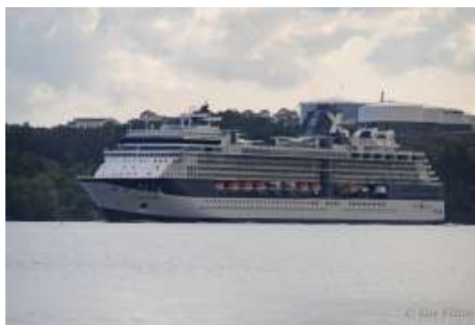
Celebrity Constellation lämnar Stockholm. 2012.06.05.