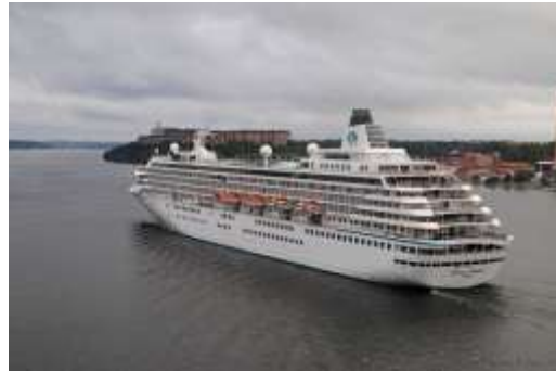
Crystal Symphony i Frihamnen 2012.06.26.

Rederi: Crystal Cruises Byggd: 1995 Längd: 237 meter GT: 51 044 Passagerare: 1010 Tidigare namn: - Antal anlöp: 3