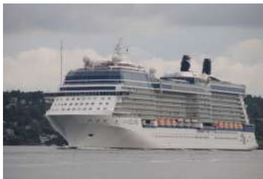
Celebrity Eclipse på utgående vid Klippudden. 2011.07.25.