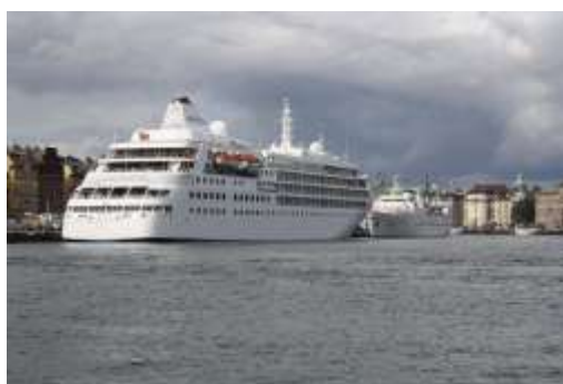
Silver Cloud, fotograf Andreas Lundqvist.

Rederi. Silversea cruises Byggd: 1994 Längd: 156 meter GT: 16 927 Passagerare: 296 Tidigare namn: - Antal anlöp: 2