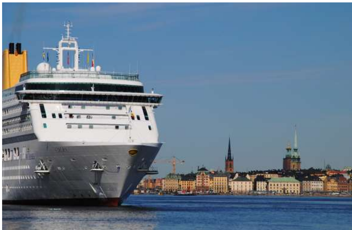
Aurora lägger till vid Stadsgården 8 maj.

C Columbus (med nytt namn f.d. Insignia) Costa Fortuna Costa Voyager (med nytt namn f.d. Grand Voyager) Hamburg (med nytt namn f.d. C Columbus) MSC Magnifica Ocean Princess (med nytt namn f.d. Tahitian Princess) Quest for Adventure (med nytt namn f.d. Saga Pearl II, Astoria) Ryndam Saga Sapphire (med nytt namn f.d. Europa) Wind Surf