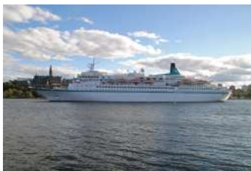
Albatros lämnar Stadsgården. 2012.09.05.