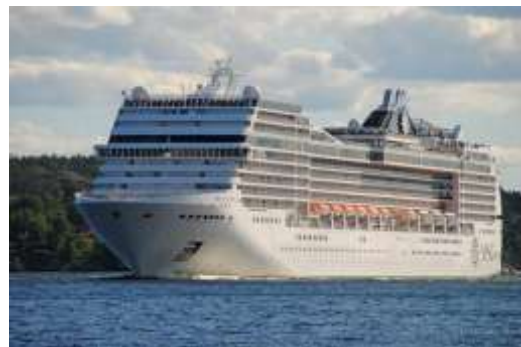
MSC Magnifica passerar Klippudden. 2012.06.19.

Rederi: MSC Cruises Byggd: 2010 Längd: 294 meter GT: 92 490 Passagerare: 2550 Tidigare namn: - Antal anlöp: 7