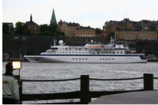
Clipper Odyssey lämnar Stockholm, 2012.07.22.

Rederi: Clipper group Byggd: 1975 Längd: 100 meter GT: 5 218 Passagerare: 122 Tidigare namn: Alla Tarasova Antal anlöp: 1