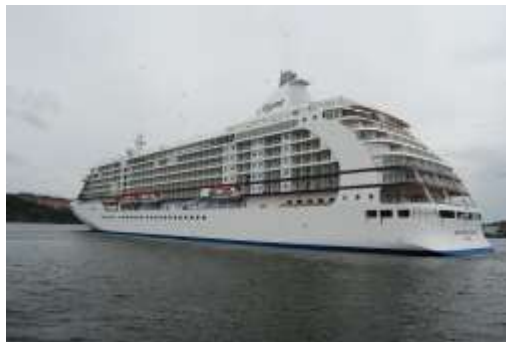
Seven Seas Voyager, 2009.06.18.

Rederi: Regent seven seas cruises Byggd: 2003 Längd: 294 meter GT: 41 827 Passagerare: 752 Tidigare namn: - Antal anlöp: 4