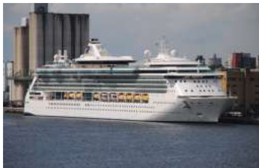
Brilliance of the Seas i Frihamnen. 2012.08.06.