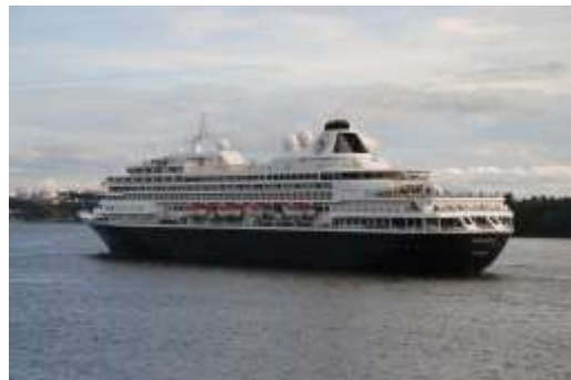
Prinsendam

Rederi: Holland America Line Byggd: 1988 Längd: 205 meter GT: 37 983 Passagerare: 840 Tidigare namn: Royal Viking Sun, Seabourn Sun Antal anlöp: 2