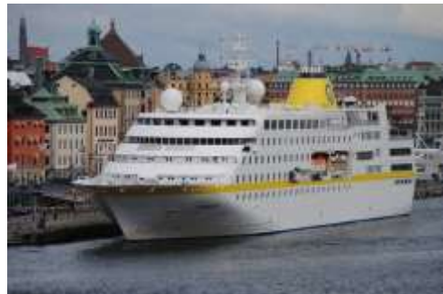
Hamburg vid Skeppsbron. 2012.08.09.

Rederi: Plantours & Partner Byggd: 1997 Längd: 144 meter GT: 14 903 Passagerare: 421 Tidigare namn: C Columbus Antal anlop: 2