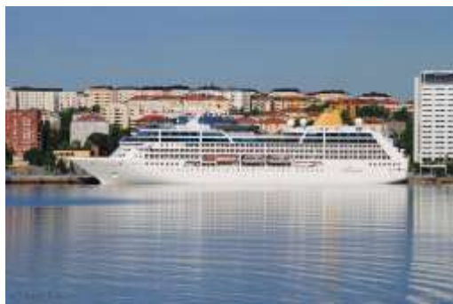
Adonia i Värtahamnen. 2012.05.24