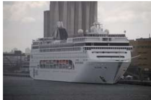
MSC Lirica i Frihamnen. 2012.06.04.

Rederi: MSC Cruises Byggd: 2003 Längd: 293 meter GT: 59 058 Passagerare: 2065 Tidigare namn: - Antal anlöp: 3