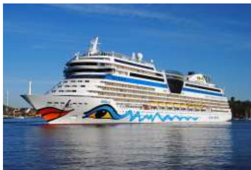
AIDAsol lägger till vid Stadsgården. 2012.05.07.