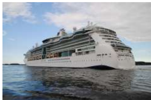
Jewel of the Seas utanför Lidingö. 2012.06.12.

Rederi: Royal Caribbean cruises line Byggd: 2004 Längd: 293 meter GT: 90 090 Passagerare: 2500 Tidigare namn: - Antal anlop: 8