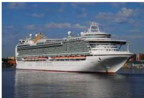
Azura ankommer Frihamnen. 2012.05.24.