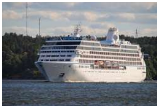
Nautica passerar Klippudden. 2012.06.19.

Rederi: Oceania Cruises Byggd: 1998 Längd: 181 meter GT: 30 277 Passagerare: 824 Tidigare namn: R Five Antal anlop: 3