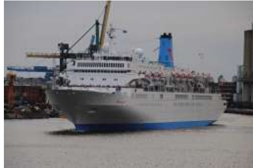
Thomson Spirit avgår Frihamnen. 2012.05.14.

Rederi: Thomson Cruises Byggd: 1983 Längd: 214 meter GT: 33 930 Passagerare: 1350 Tidigare namn: Nieuw Amsterdam, Patriot Antal anlöp: 5