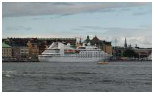
Seabourn Pride, 2008.08.31.

Rederi: Yachts of Seabourn Byggd: 1988 Längd: 134 meter GT: 9 975 Passagerare: 212 Tidigare namn: - Antal anlöp: 5