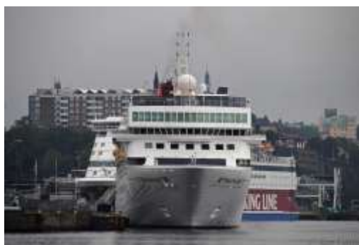
Braemar vid Stadsgården. 2012.09.26.