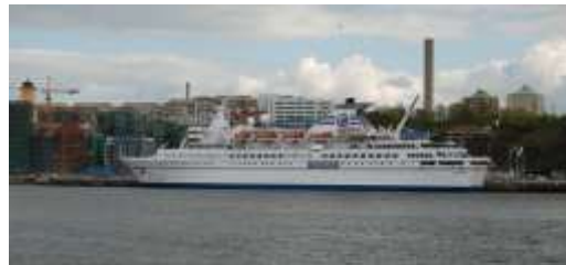
Delphin vid Stadsgården. 2009.05.04.

Rederi: Passat Kreuzfarthen Byggd: 1975 Längd: 155 meter GT: 16 214 Passagerare: 590 Tidigare namn: Belorussiya, Kazakhstan II Antal anlöp: 4