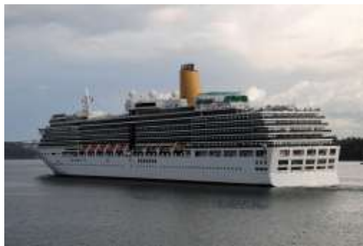
Arcadia, 2011.08.09.

Rederi: P&O Cruises Byggd: 2005 Längd: 285 meter GT: 82 972 Passagerare: 2556 Tidigare namn: (Queen Victoria) Antal anlöp: 3