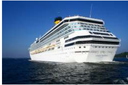
Costa Pacifica, 2011.05.31.

Rederi: Costa Cruises Byggd: 2009 Längd: 290 meter GT: 114 500 Passagerare: 3700 Tidigare namn: - Antal anlöp: 3