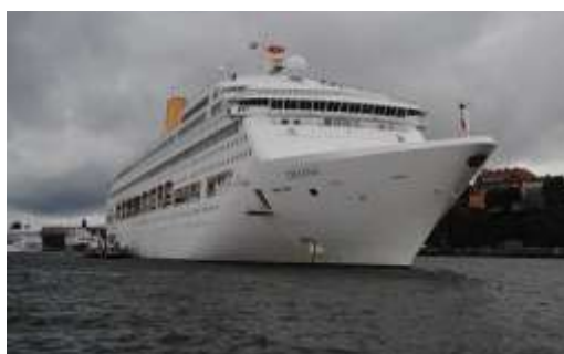
Oriana på Strömmen. 2012.06.25.

Rederi: P&O Cruises Byggd: 1995 Längd: 164 meter GT: 69 153 Passagerare: 2179 Tidigare namn: - Antal anlop: 3