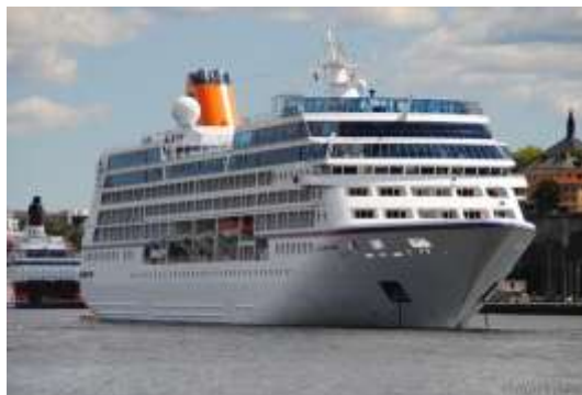
C. Columbus 2 på Strömmen. 2012.06.28.