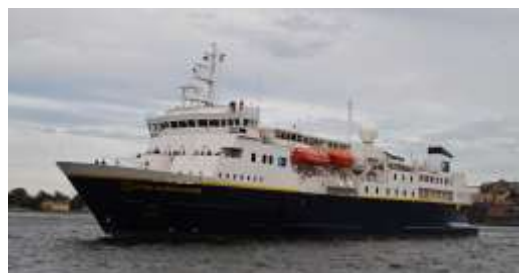
National Geographic Explorer, 2011.09.05.

Rederi: Lindblad Expedition Byggd: 1982 Längd: 112 meter GT: 6 471 Passagerare: 181 Tidigare namn: Midnatsol, Lyngen Antal anlöp: 2