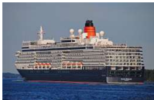
Queen Elizabeth passerar Gåshaga. 2012.06.13.

Rederi: Cunard Byggd: 2010 Längd: 294 meter GT: 90 900 Passagerare: 2092 Tidigare namn: - Antal anlöp: 2