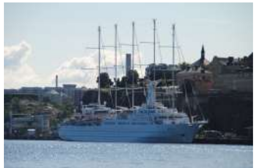
Wind Surf vid Stadsgården 2012.08.11.

Rederi: Windstar Cruises Byggd: 1990 Längd: 187 meter GT: 14 745 Passagerare: 347 Tidigare namn: Club Med I Antal anlöp: 3