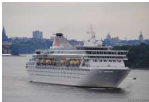
Balmoral passerar Nyckelviken. 2012.07.25.