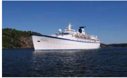
Princess Danae, 2010.06.29.

Rederi: Classic International Cruises Byggd: 1955 Längd: 162 meter GT: 16 531 Passagerare: 657 Tidigare namn: Port Melbourne, Danae, Baltica, Starlight express m.fl. Antal anlöp: 1