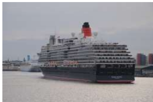
Queen Victoria avgår Frihamnen. 2012.05.14.

Rederi: Cunard Byggd: 2007 Längd: 294 meter GT: 90 049 Passagerare: 2014 Tidigare namn: - Antal anlöp: 2