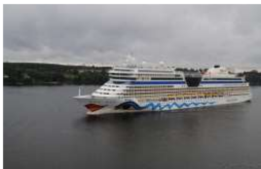
AIDAblu i Halvkakssundet. 2012.06.26.