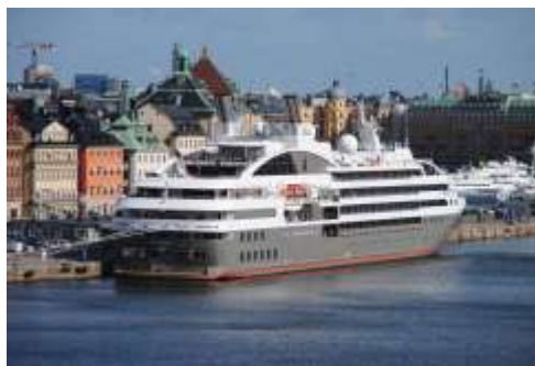
Le Boreal, 2011.05.25.

Rederi: Compagnie du ponant Byggd: 2010 Längd: 140 meter GT: 10 700 Passagerare: 264 Tidigare namn: - Antal anlöp: 2