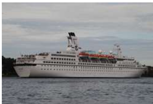
Astor, 2011.09.05.

Rederi: Transocean Tours Byggd: 1987 Längd: 176 meter GT: 20 606 Passagerare: 650 Tidigare namn: Fedor Dostoevskiy Antal anlöp: 3