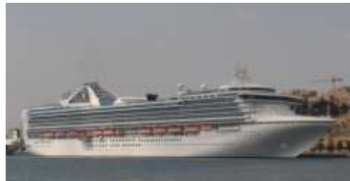
Grand Princess på Malta

Rederi: Princess Cruises Byggd: 1998 Längd: 290 meter GT: 108 806 Passagerare: 3100 Tidigare namn: Antal anlop: 1