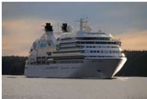
Seabourn Sojourn passerar Vindö. 2012.06.22.

Rederi: Yachts of Seabourn Byggd: 2010 Längd: 198 meter GT: 32 000 Passagerare: 450 Tidigare namn: - Antal anlöp: 5