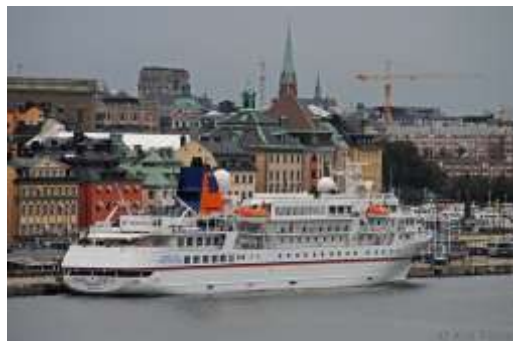
Bremen vid Skeppsbron. 2012.09.18.