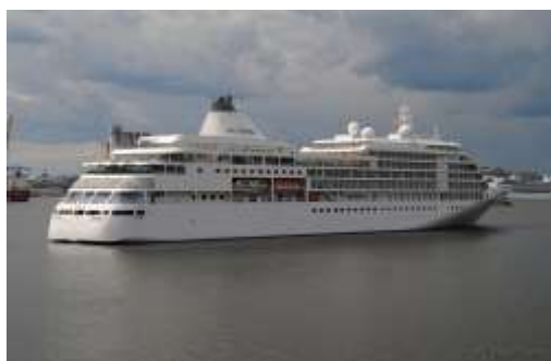
Silver Whisper ankommer Värtahamnen. 2012.06.21.

Rederi. Silversea cruises Byggd: 2001 Längd: 182 meter GT: 28 258 Passagerare: 388 Tidigare namn: - Antal anlöp: 6