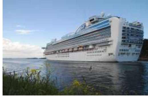
Emerald Princess vid Oxdjupet. 2012.06.12.

Rederi: Princes Cruises Byggd: 2007 Längd: 290 meter GT: 113 561 Passagerare: 3782 Tidigare namn: - Antal anlöp: 11