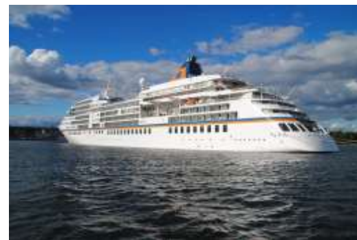
Europa på Strömmen. 2012.09.05.

Rederi: Hapag Lloyd Byggd: 1999 Längd: 198 meter GT: 28 890 Passagerare: 450 Tidigare namn: - Antal anlöp: 2