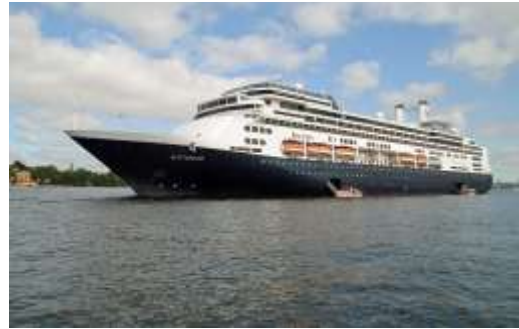
Rotterdam, 2011.08.23.

Rederi: Holland America Line Byggd: 1997 Längd: 237 meter Br: 59 855 Passagerare: 1802 Tidigare namn: - Antal anlöp: 1