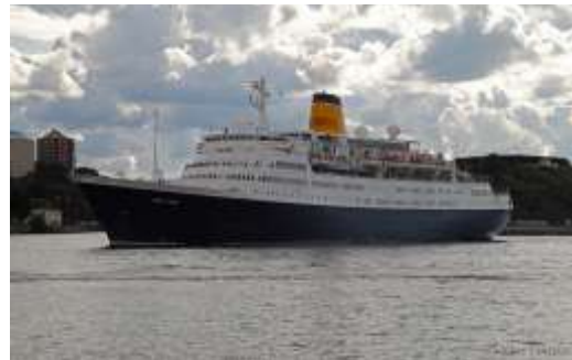
Saga Ruby lämnar Stadsgården. 2012.08.24.

Rederi: Saga Cruises Byggd: 1973 Längd: 191 meter GT: 24 492 Passagerare: 655 Tidigare namn: Vistafjord, Caronia Antal anlöp: 2