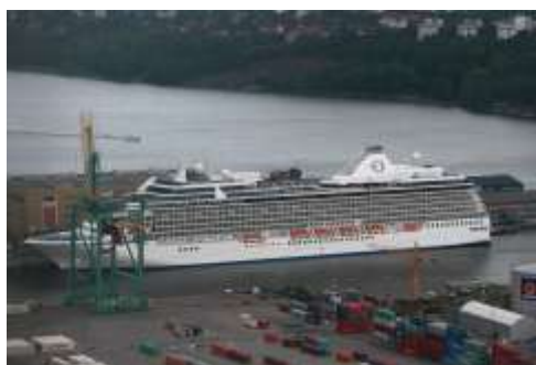
Marina, 2011.06.21

Rederi: Oceania Cruises Byggd: 2011 Längd: 237 meter GT: 65 000 Passagerare: 1258 Tidigare namn: - Antal anlöp: 3