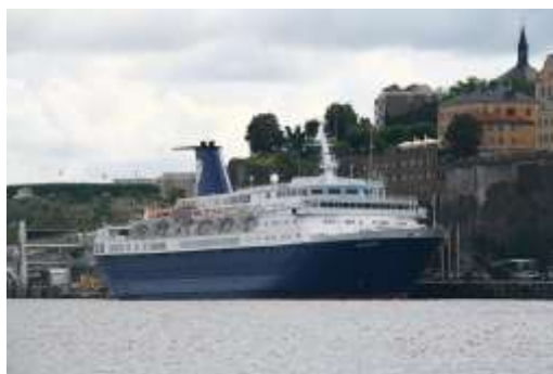
Ocean Countess vid Stadsgården, fotograf Mats Östman.

Rederi: Maritime & Cruising Byggd: 1975 Längd: 164 meter GT: 17 593 Passagerare: 898 Tidigare namn: Cunard Countess, Awani dream II, Olympic Countess, Ruby m.fl. Antal anlop: 1