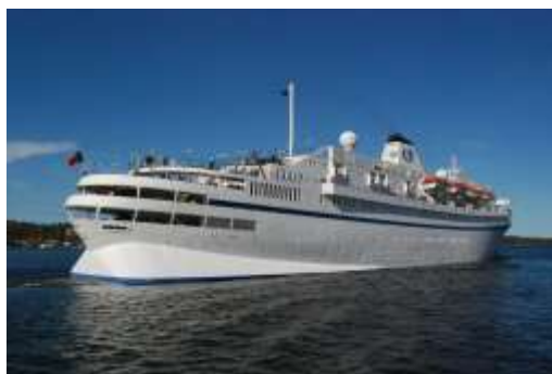
Athena, 2010.05.06.

Rederi: Classic international cruises Byggd: 1948 Längd: 160 meter GT: 16 144 Passagerare: 556 Tidigare namn: Stockholm, Volker Völkerfreundschaft, Fridtjof Nansen m.fl Antal anlöp: 2