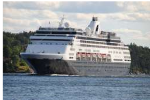
Ryndam på utgående vid Klippudden. 2012.06.19.

Rederi: Holland America Line Byggd: 1994 Längd: 219 meter GT: 55 451 Passagerare: 1627 Tidigare namn: - Antal anlöp: 2