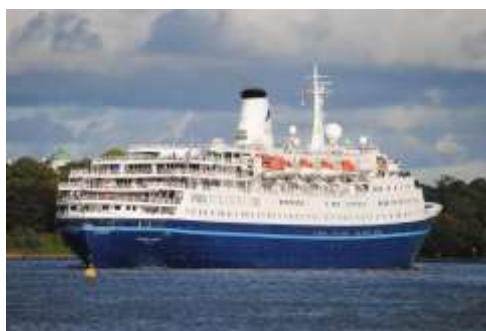
Marco Polo, 2010.09.17.

Rederi: Maritime and cruising Byggd: 1966 Längd: 176 meter GT: 22 080 Passagerare: 915 Tidigare namn: Aleksandr Pushkin Antal anlöp: 3