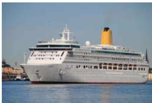
Aurora vid Stadsgården. 2012.05.08.

Rederi: P&O Cruises Byggd: 2000 Längd: 270 meter GT: 76 152 Passagerare: 1868 Tidigare namn: - Antal anlöp: 3