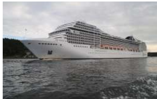
MSC Poesia passerar Klippudden. 2012.06.13.

Rederi: MSC Cruises Byggd: 2008 Längd: 294 meter GT: 92 490 Passagerare: 2550 Tidigare namn: - Antal anlöp: 10