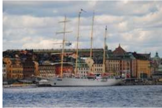
Star Flyer vid Skeppsbron. 2012.07.31.

Rederi: Star Clippers Byggd: 1991 Längd: 116 meter GT: 2 298 Passagerare: 170 Tidigare namn: - Antal anlöp: 4