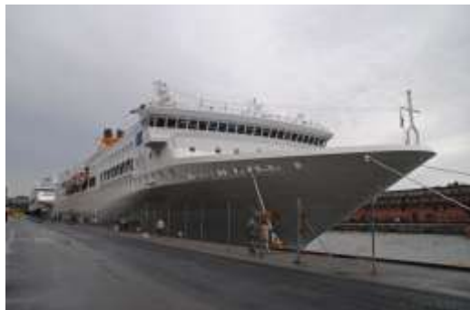
Costa Voyager i Frihamnen. 2012.06.16.

Rederi: Costa Cruises Byggd: 2000 Längd: 180 meter GT: 24 430 Passagerare: 920 Tidigare namn: Grand Voyager, Olympia Voyager, Olympic Voyager Antal anlöp: 1