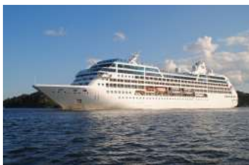
Ocean Princess passerar Klippudden 2012.06.13.

Rederi: Princess Cruises Byggd: 1999 Längd: 181 meter GT: 30 277 Passagerare: 826 Tidigare namn: Tahitian Princess, R Four Antal anlop: 1