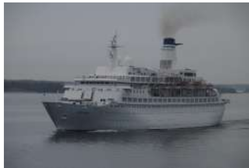
Discovery ute på Kanholmsfjärden 2012.05.16.

Rederi: Discovery world cruises Byggd: 1972 Längd: 168 meter GT: 21 186 Passagerare: 796 Tidigare namn: Island Venture, Island Princess, Hyundai Pungak, Platinum Antal anlöp: 1