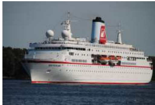
Deutschland, 2011.08.05.

Rederi: Peter Deilmann Byggd: 1998 Längd: 175 meter GT: 22 400 Passagerare: 560 Tidigare namn: - Antal anlöp: 3