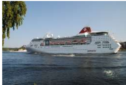
Empress, 2011.06.08.

Rederi: Pullmantur Byggd: 1990 Längd: 211 meter GT: 48 563 Passagerare: 805 Tidigare namn: Nordic Empress, Empress of the Seas Antal anlöp: 10