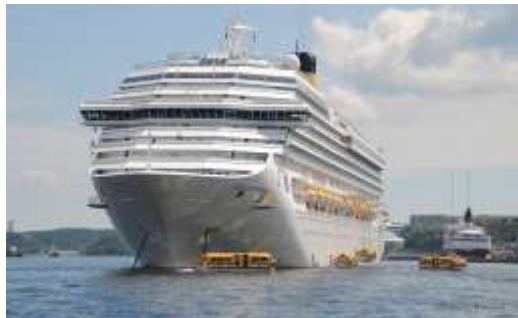
Costa Fortuna på Strömmen. 2012.06.12.

Rederi: Costa Cruises Byggd: 2003 Längd: 272 meter GT: 102 587 Passagerare: 2680 Tidigare namn: - Antal anlöp: 6