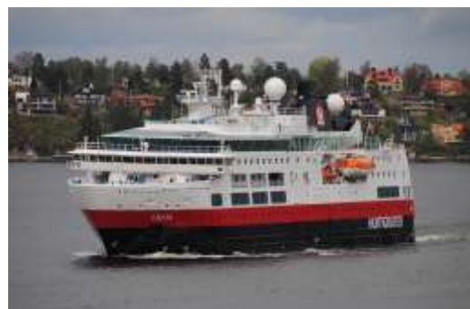
Fram passerar Nacka. 2012.05.12.

Rederi: Hurtigruten Byggd: 2007 Längd: 113 meter GT: 12 700 Passagerare: 318 Tidigare namn: - Antal anlöp: 1