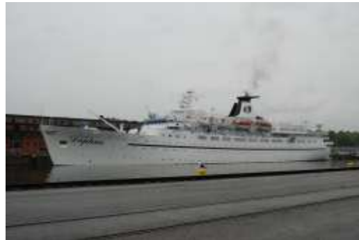
Princess Daphne, 2009.05.22.

Rederi: Ambiente Kreuzfarthen (utchartrad av CIC) Byggd: 1955 Längd: 162 meter GT: 15 833 Passagerare: 503 Tidigare namn: Port Sydney, Daphne, Ocean Monarch, Switzerland m.fl. Antal anlöp: 4